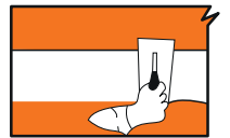
4. ฉาบปูนกับอีกครั้ง โดยให้รอยฉาบกว้างอย่างน้อย 11 นิ้ว ฉาบให้ผิวเรียบเสมอกัน หลังจากปูนแห้งสนิท ใช้กระดาษทรายขัดตกแต่งผิวอีกครั้ง